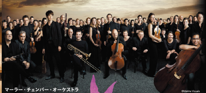
マーラー・チェンバー・オーケストラ