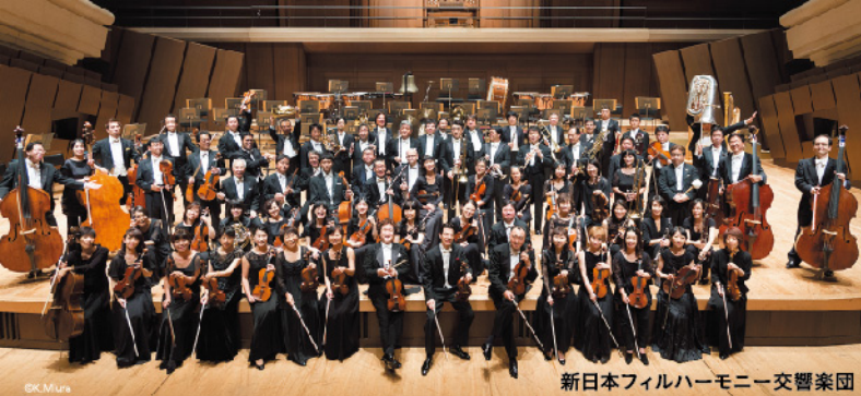
新日本フィルハーモニー交響楽団